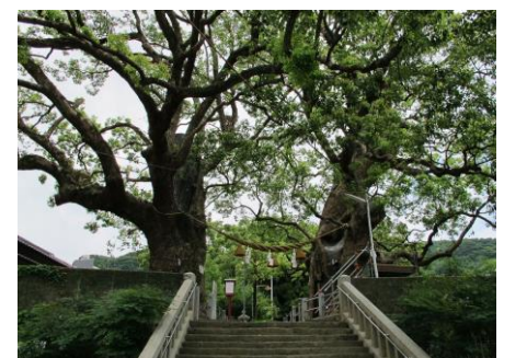
境内の被爆クスの木